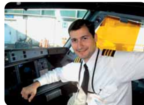
Michael em terras e ares norte-americanos